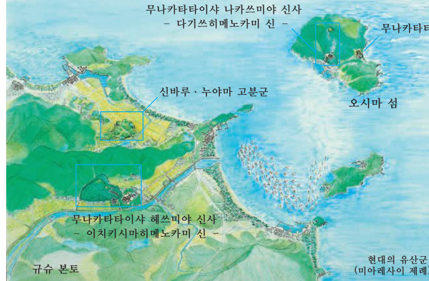
무나카타타이샤 나카쓰미야 신사 - 다기쓰히메노카미 신 -

무나카타타이샤 신사는 약 60km범위에 위치한 3개의 따로 떨어진 신앙의 장소, 즉 오키노시마 섬의 오키쓰미야 신사, 오시마 섬의 나카쓰미야 신사 그리고 규슈 본토의 헤쓰미야 신사로 구성된 큰 신사입니다. 세 개의 신사 각각이 고대 제사 유적을 기원으로 하고 있으며, 지금도 사용되고 있는 신앙의 장소입니다. 고대 호족 무나카타 가문이 오키노시마 섬에 깃든 신에 대한 신앙을 통해 길러 온 무나카타의 세 여신 신앙은 오늘날까지도 계승되고 있습니다.