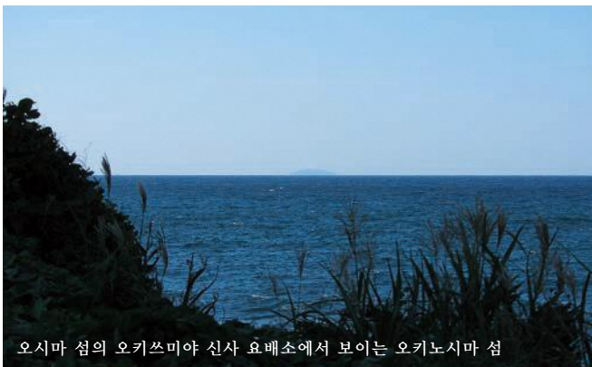
오시마 섬의 오키쓰미야 신사 요배소에서 보이는 오키노시마 섬

고대 호족 무나카타 가문은 오키노시마 섬에 깃든 신에 대한 신앙을 통해 무나카타의 세 여신 신앙을 길러 왔습니다. 오키노시마 섬은 세 여신을 모시는 무나카타타이샤 신사의 일부로 섬을 둘러싼 금기와 요배의 전통과 더불어 오늘날까지 신성한 존재로서 계승되고 있습니다.