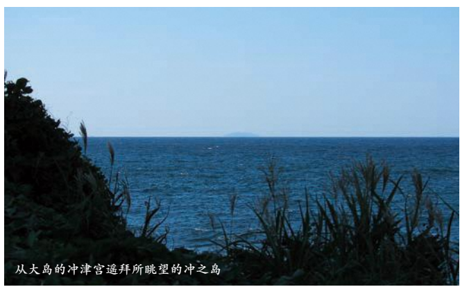
从大岛的冲津宫遥拜所眺望的冲之岛

位于距离九州本土约 60 公里的冲之岛与大岛以及九州本土的相关遗产群，从古代发展至现代，传承至今，是崇拜神圣之岛的文化传统的显著物证。随着日本列岛、朝鲜半岛以及中国大陆各国间交流活跃，与之相伴的是，冲之岛上留存着的从 4 世纪下半叶持续至 9 世纪末的航海安全相关古代祭祀遗迹。古代豪族的宗像氏，从宿于冲之岛的神明信仰，培育出宗像三女神信仰。冲之岛作为供奉三女神的宗像大社的一部分，与该岛相关的禁忌及遥拜的传统一起，共同被视为一种神圣的存在而传承至今。