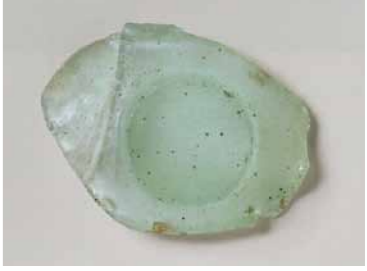
カットガラス碗片