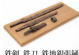
鉄剣、鉄刀、鉄地銀張鍔