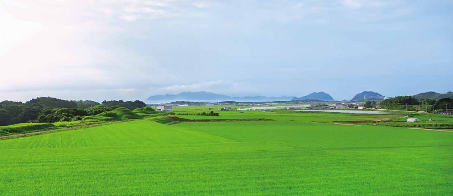
海を望む台地上に立地する新原・奴山古墳群