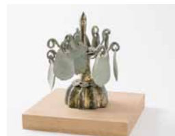
金銅製歩揺付雲珠