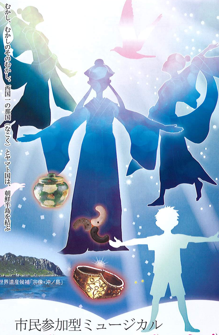
世界遺産候補「宗像・沖ノ島」