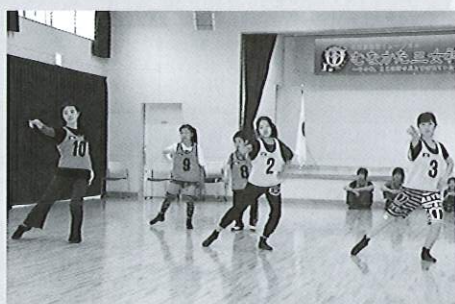
オーディションの様子