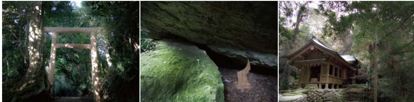
沖ノ島は女界灘のほぼ真ん中に浮かぶ絶海の孤島。その中腹に田心姫神を祀る宗像大社の沖津宮が鎮座し、本土の辺津宮より神職が10日交代でたった一人奉仕しています。

今回開催する特別展「宗像・沖ノ島 大国宝展」は、神の島・沖ノ島の価値と魅力をより多くの方々に伝えるため企画されました。平素の宗像大社神宝館の常設展示ではみることの出来ない、圧倒的な規模と点数の沖ノ島出土の国宝の数々を通じ、遥か古代に海を越えて祈りを捧げた人々の息吹を肌で感じていただけるものと思います。