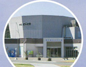
周辺スポット 海の道むなかた館