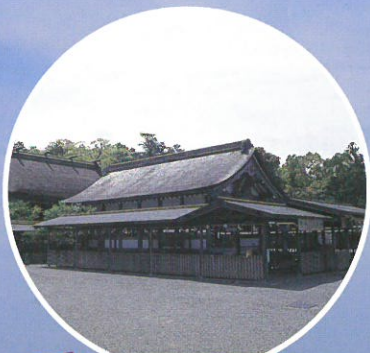
構成資産 宗像大社辺津宮