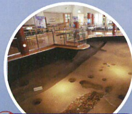
周辺スポット 在自唐坊跡展示館