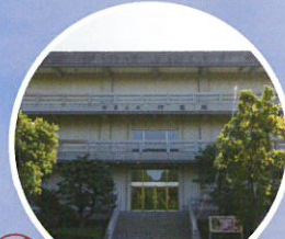
周辺スポット 宗像大社神宝館