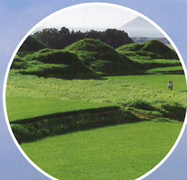
構成資産 新原・奴山古墳群