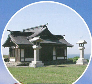
構成資産 沖津宮遙拝所