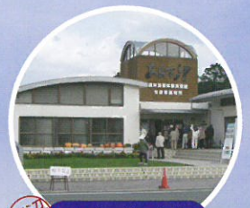
周辺スポット あんずの里