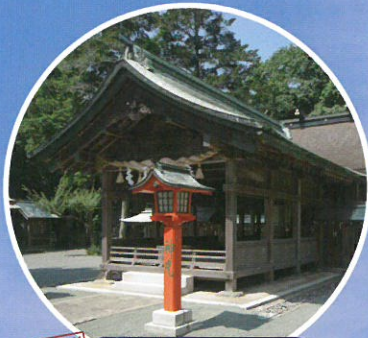
構成資産 宗像大社中津宮