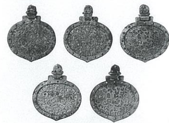
金銅製心葉形杏葉 7号遺跡出土 古墳時代 国宝