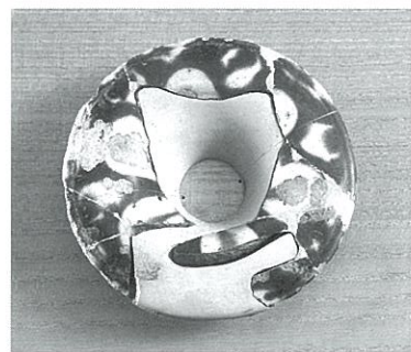
唐三彩長頸瓶片 5号遺跡出土 中国・唐時代 国宝