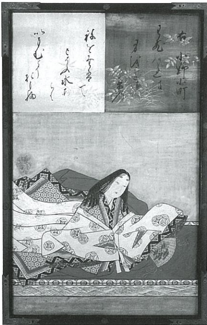
三十六歌仙図扁額 小野小町 狩野安信筆 延宝8年(1680)