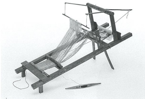
金銅製高機 伝沖ノ島出土 奈良~平安時代 国宝